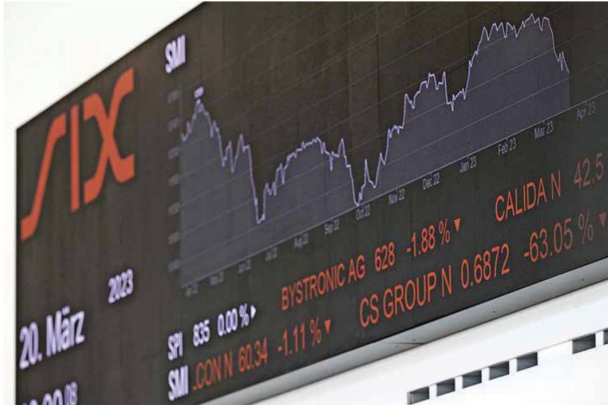
Die SIX Swiss Exchange ist die grösste Schweizer Börse und Herausgeberin des Aktienindex Swiss Performance Index (SPI).

Die SIX Swiss Exchange ist die grösste Schweizer Börse